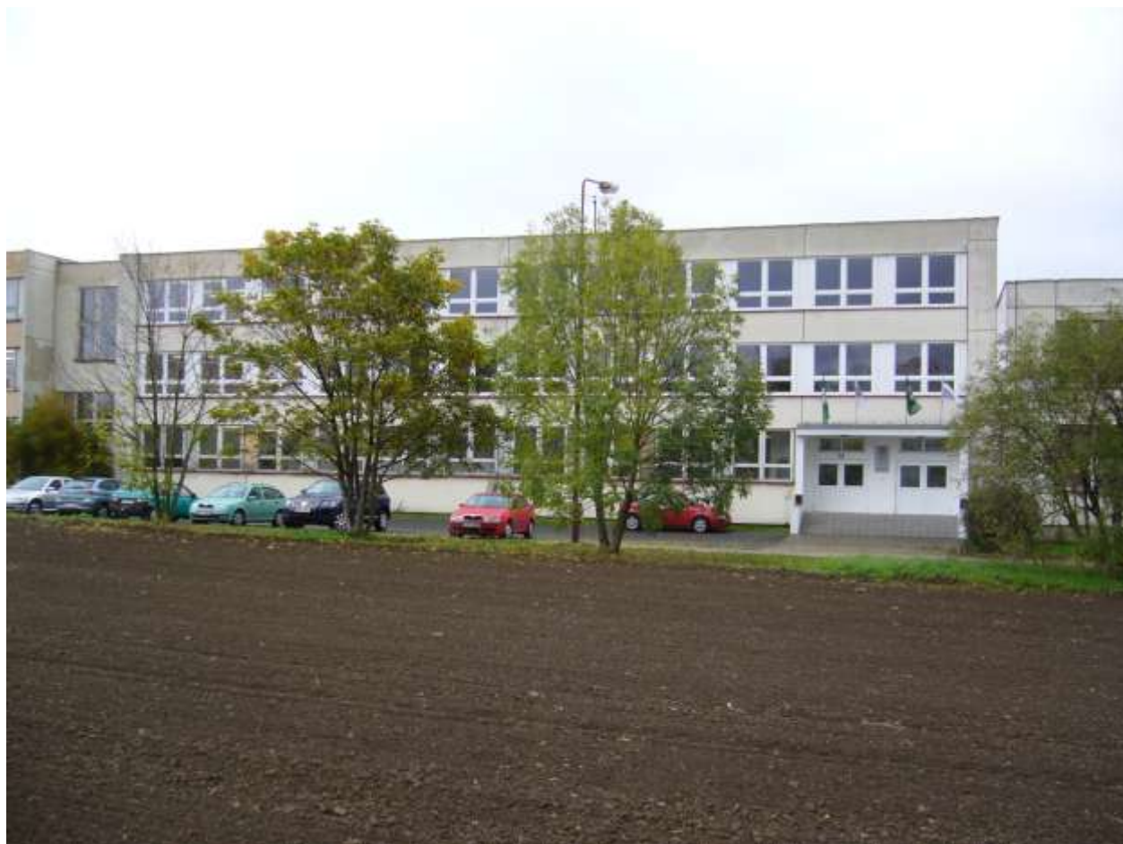
Budova školy v Roudnici nad Labem