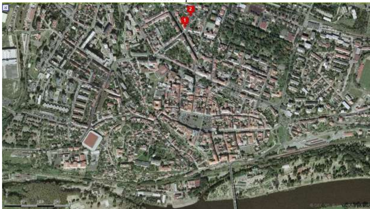
Letecká mapa města